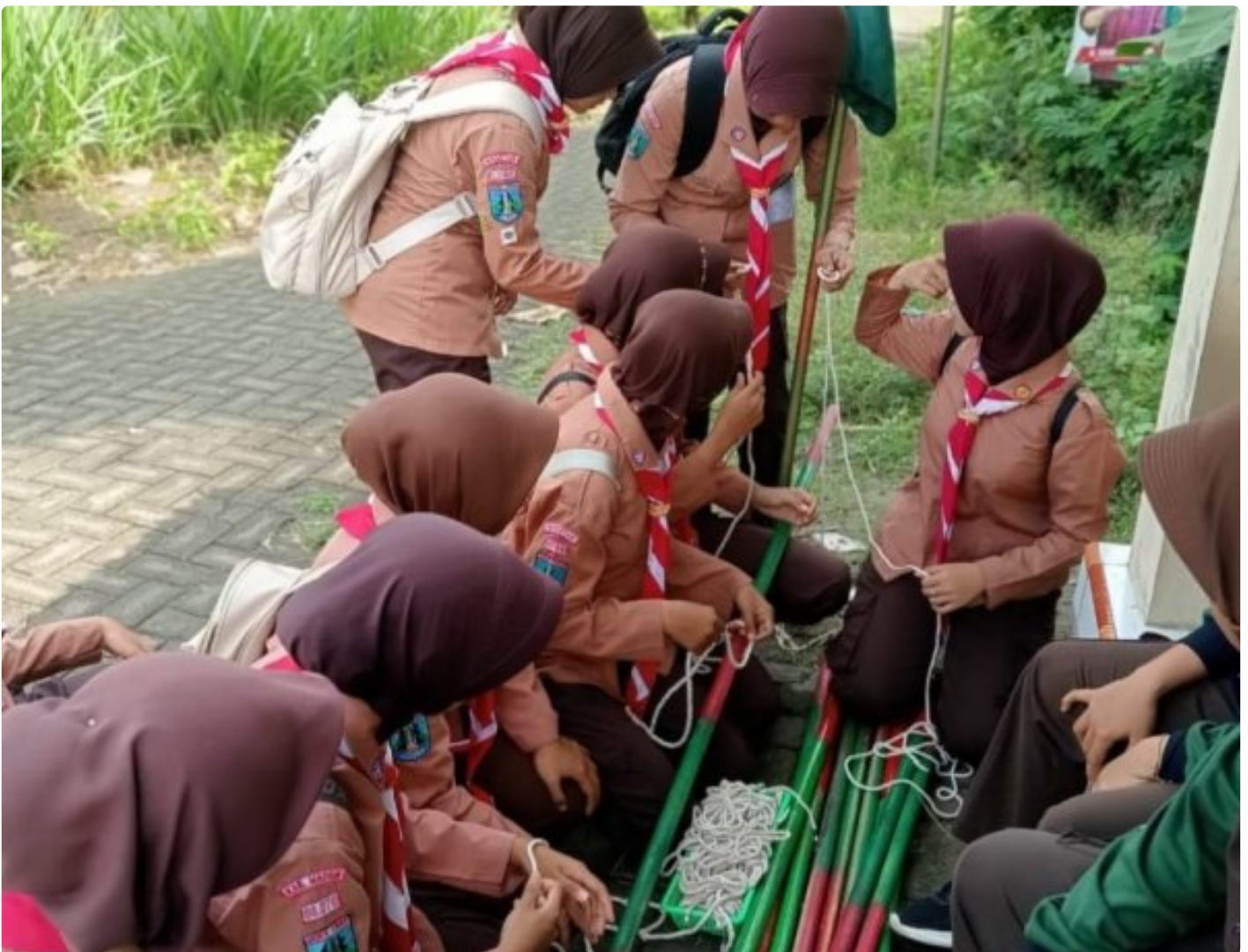
Saka Wira Kartika Koramil 0804/08 Barat Gelar Penjelajahan Dalam Penempuhan SKK

Magetan. - Saka Wira Kartika Koramil Tipe B 0804/08 Barat menggelar kegiatan penjelajahan penempuhan SKK di wilayah Koramil Tipe B 0804/08 Barat dan