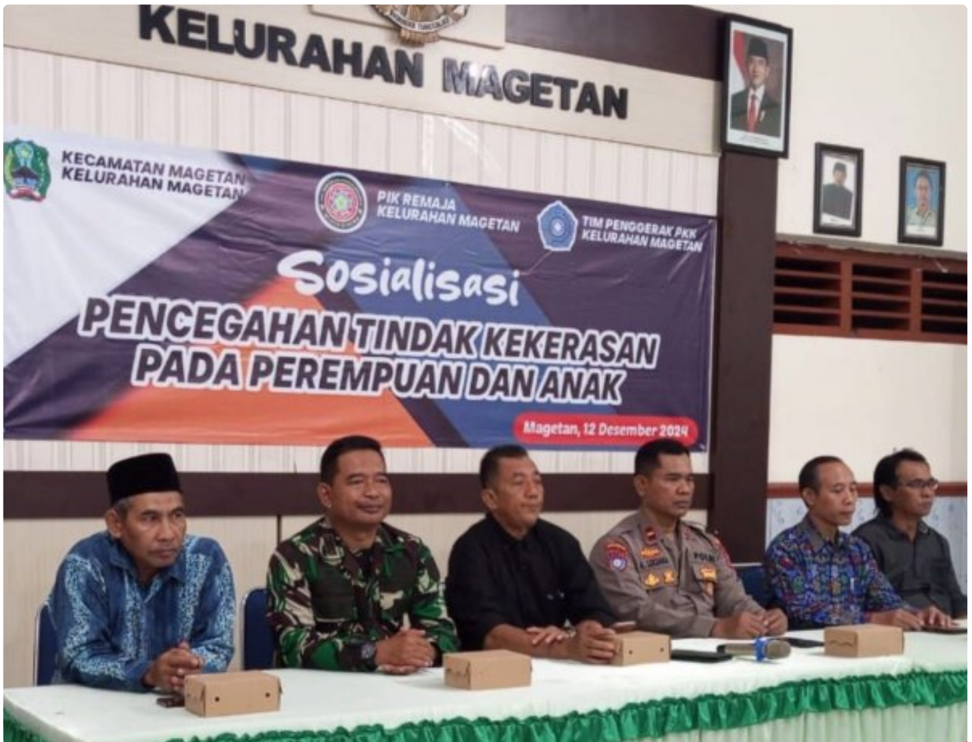
Danramil 0804/01 Magetan Hadiri Sosialisasi Pencegahan Tindak Kekerasan Pada Perempuan Dan Anak