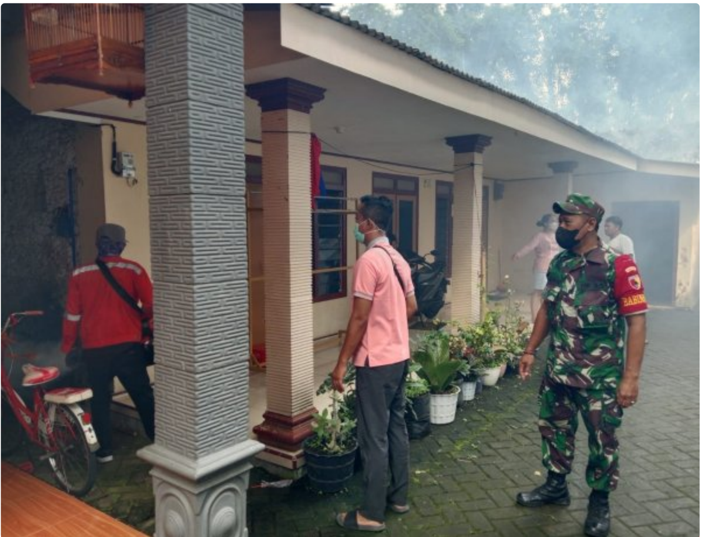
Babinsa Bersama Dinkes Dampingi Fogging, Cegah DBD di Wilayah Desa Binaan